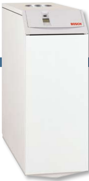
◀ Bosch EHLE-ketel

Een EHLE-ketel én een EBU-boiler van Bosch vormen een krachtige combinatie voor een comfortabel binnenklimaat en heel veel warm water in de badkamer en de keuken. Een combinatie waarop u blind kunt vertrouwen. Dag in, dag uit!